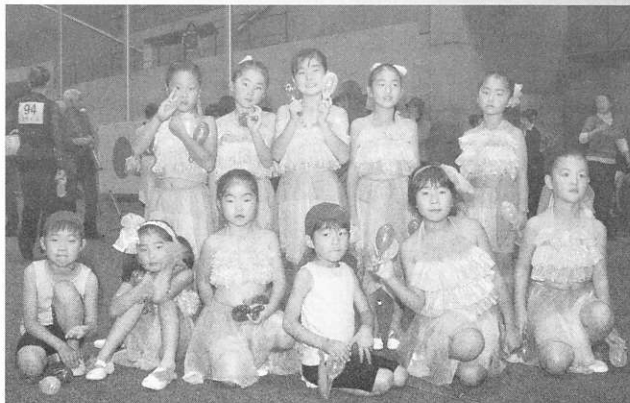
三笠宮杯子供ダンス運動に参加されたこども達