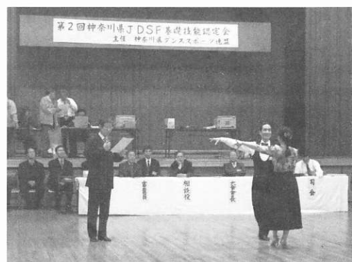
神奈川県基礎技術認定会

組織面では今年10月鎌倉市ダンススポーツ連盟と藤沢市ダンススポーツ連盟が正加盟団体として、また横須賀市と逗子市が仮加盟団体として我々の仲間入りをしました。これによって市連としては川崎市、横浜市、相模原市のほか上記の4市が加わって計7市連となり