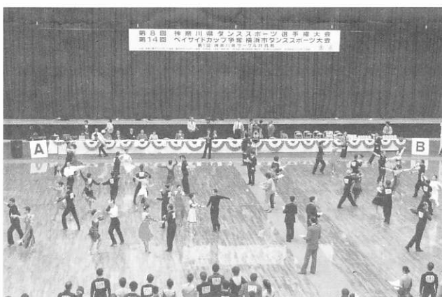
第8回神奈川県ダンススポーツ選手権大会

ダンススポーツは、年齢性別を超えて親しむことができるすばらしい“生涯スポーツ”です。また、音楽を感じながら自分の体力と能力に応じて日頃のトレーニングを重ねていけば、それなりの結果を出すことができる楽しい“競技スポーツ”でもあります。