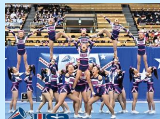
チアリーディング世界大会4位 横浜ドルフィンズ