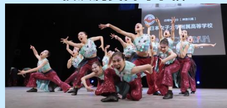
日本女子大学付属高等学校