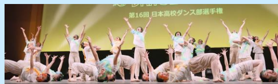
横浜創英高等学校