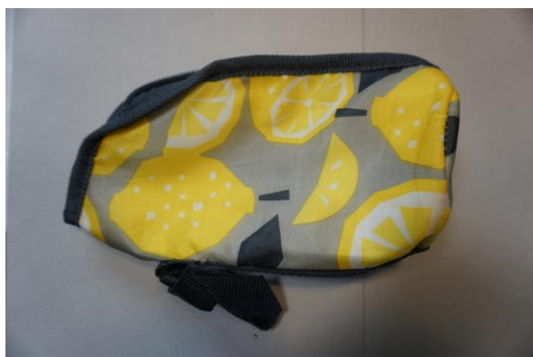
C:ペットボトルケース 1個